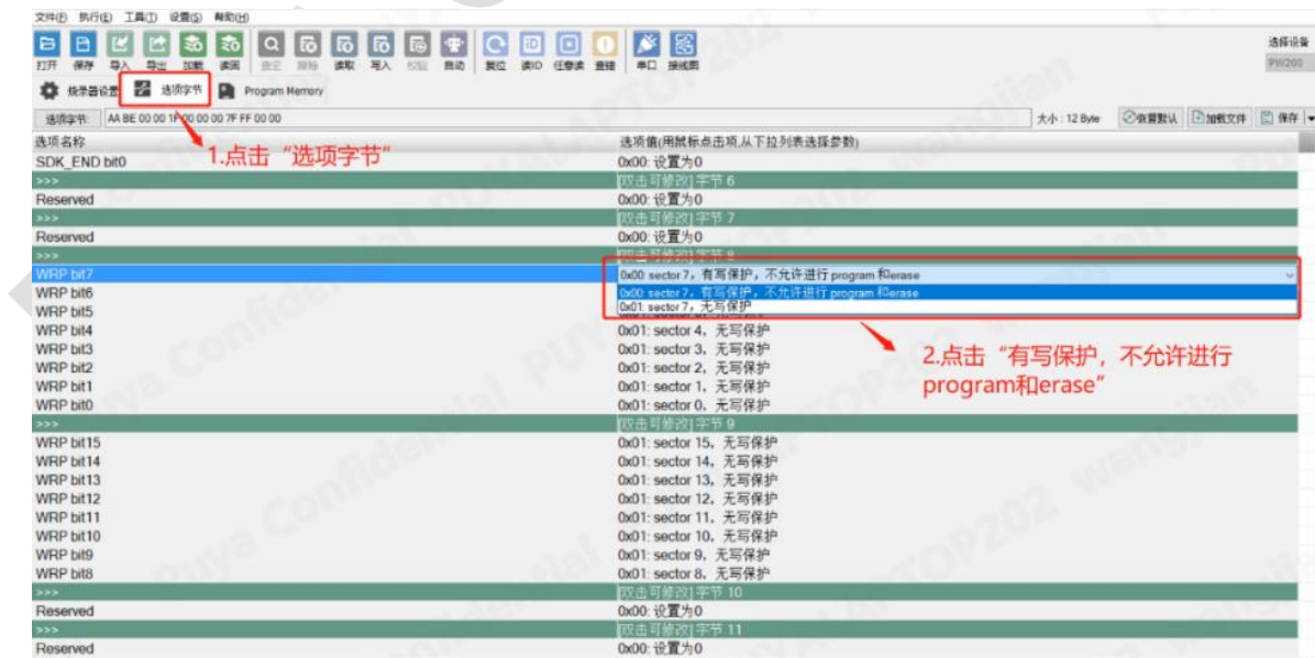
图 12-1 创芯工坊操作 Option 写保护