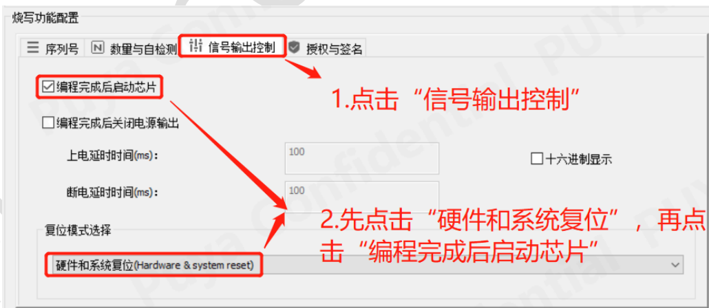
图 12-3 创芯工坊操作勾选“编程后重启芯片”