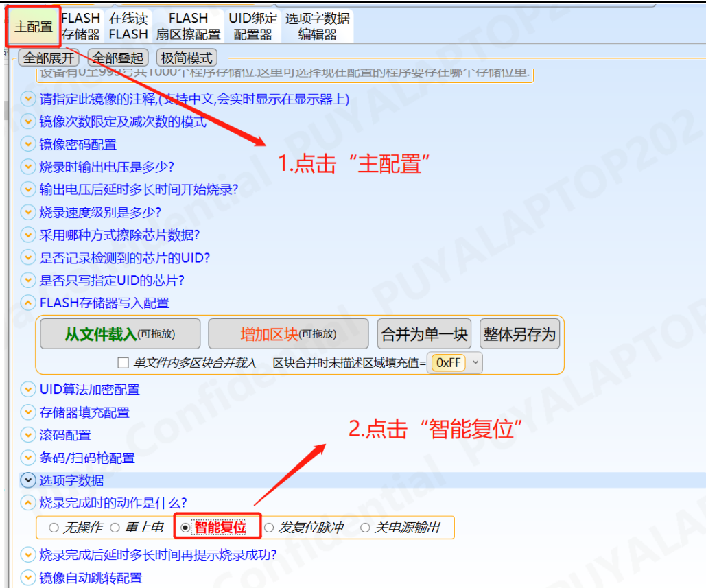
图 12-4 轩微操作“智能复位”