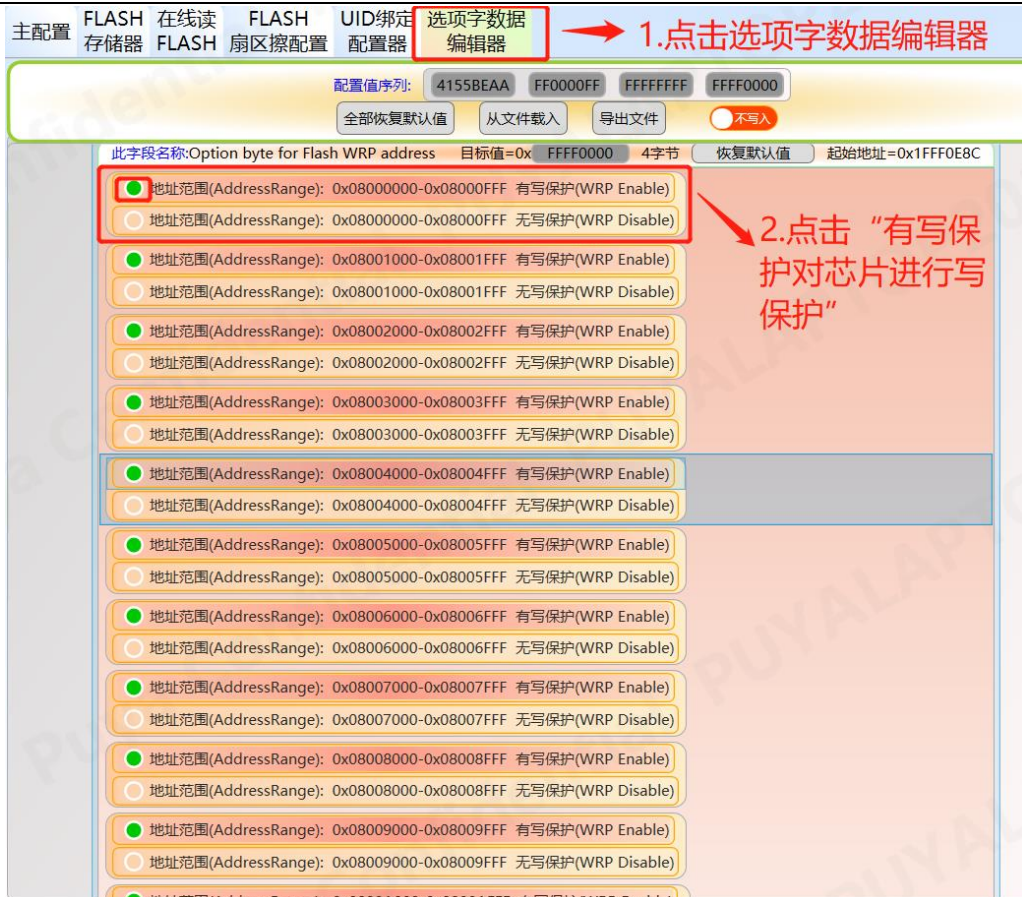
图 12-2 轩微操作 Option 写保护